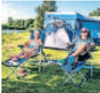
▲ Veel Nederlanders kampeerden afgelopen zomer dicht bij huis.