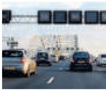
▲ De Van Brienoordbrug.