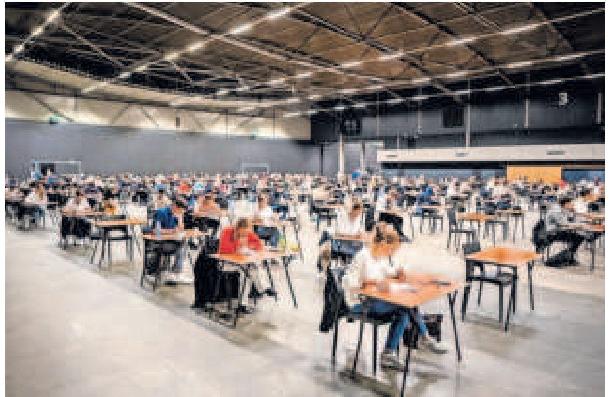
▲ Studenten doen weer massaal tegelijk een tentamen.