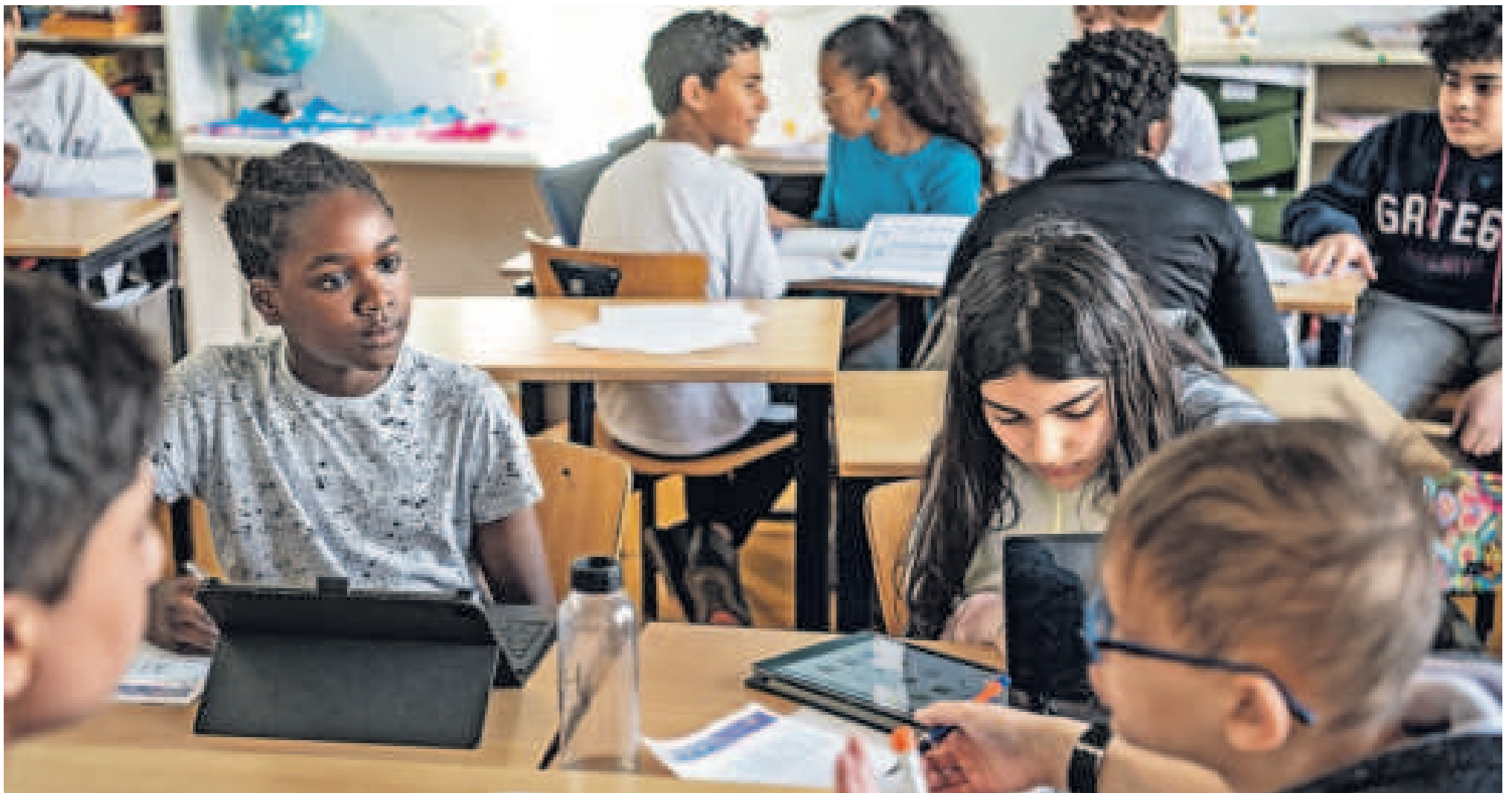
De basisschool Het Atelier in Diemen-Zuid kreeg onlangs een toestroom van leerlingen met hoogopgeleide ouders.