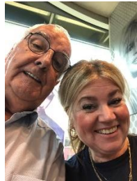
Kapsalon Lydia (al bijna 30 jaar)