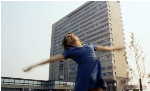
Uit welke film is deze still?

Als u nou wilt testen hoeveel u nog van de EUR en Erasmus weet, doe dan de eerstejaars quizz in Erasmus Magazine : tien min of meer historische vragen, zoals Welke Nederlandse speelfilm werd op de campus opgenomen. Alleen jonge studenten vallen in de prijzen, sorry. U heeft alle tien (meerkeuze) vragen ongetwijfeld goed!