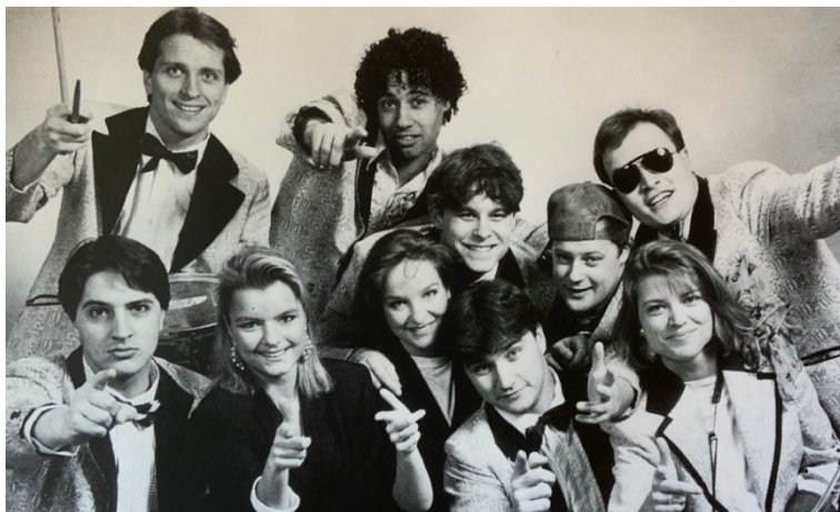
Hermes House Band 1990

Eind 1994 stond de HHB op 1 in de Nederlandse Top 40 met een bewerking van I will survive van Gloria Gainer - een versie die nog regelmatig in de Kuip is te beluisteren, mits Feyenoord scoort... Hitnoteringen volgden in 26 landen.