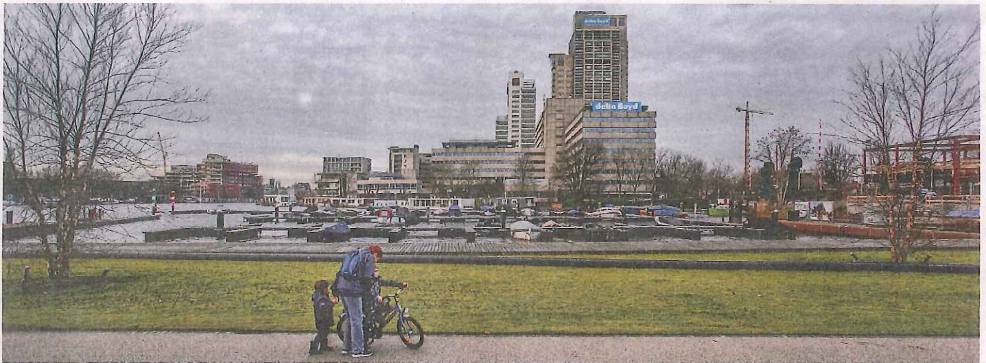
Het hoofdkantoor van Delta Lloyd aan de Amstel in Amsterdam dat als gevolg van de fusie met NN wordt gesloten.