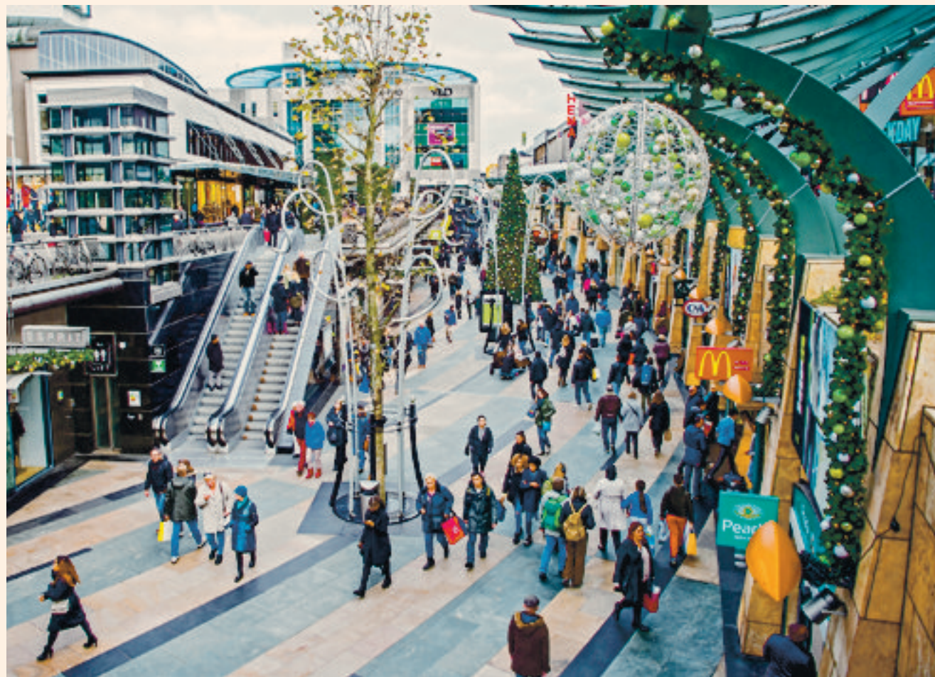
Winkelend publiek in de Rotterdamse Beurstraverse, in de volksmond bekend als de Koopgoot.

Meevallers Het CPB voorziet voor volgend jaar een begrotingsevenwicht