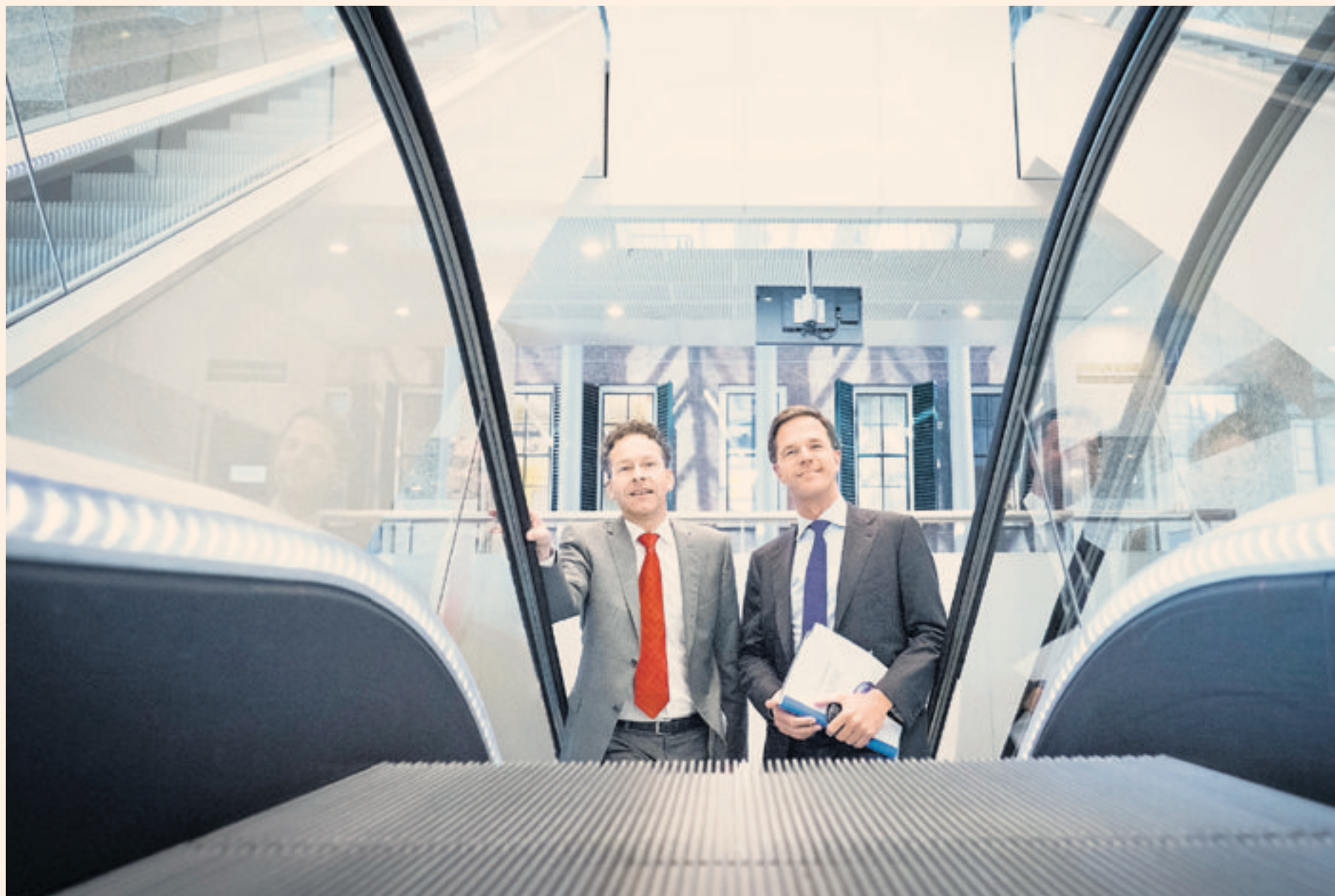
Minister van Financiën Jeroen Dijsselbloem (l) en minister-president Mark Rutte maken zich op voor de laatste Prinsjesdag van het kabinet-Rutte 2.

‘Ik heb me echt de haren uit het hoofd getrokken om die vraag te beantwoorden. Uiteindelijk heb ik vijf verklaringen. Politici ter rechterzijde grepen de crisis aan om de overheid te saneren. Dat het niet bijdroeg aan herstel, deed er politiek niet