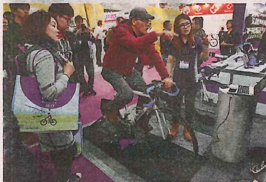
Een bezoeker rijdt op een fiets die is vastgemaakt aan een home-trainer bij de internationale fietsshow in Taipei, Taiwan.

Ook in Taiwan is fietsen razend populair