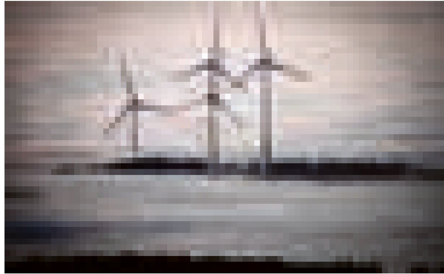
Windmolens in de buurt van Frankfurt, Duitsland.