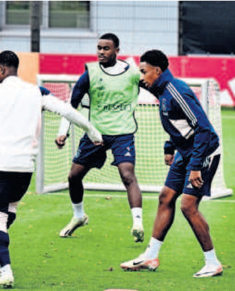
donderdag in de Europa League tegen Olympique Marseille.