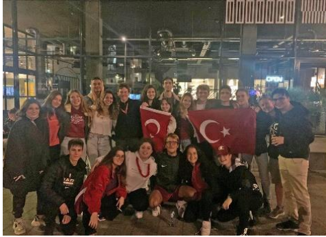
Fundraising voor de slachtoffers

De zware aardbevingen midden februari laten vele Turkse en Nederlandse studenten van Turkse afkomst niet onberoerd, integendeel. Sommigen zijn familie en vrienden verloren. Studentenvereniging Mozaïk organiseerde een walk-in en inzamelingsacties.