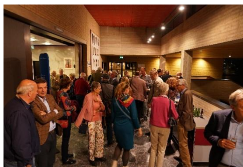
Napraten in de foyer