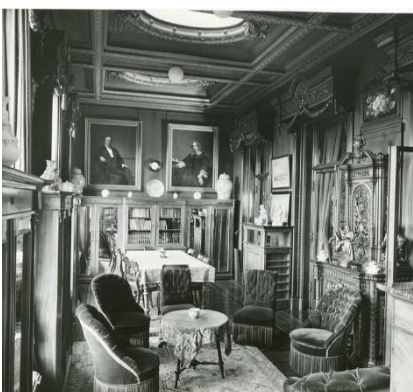
Salon Van Rijkevorsel, Parklaan 3