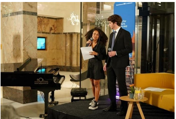
Opening Reading without Borders, EUC, 2 november