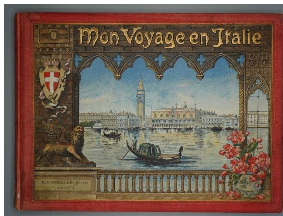
Titelbeeld van de vitrinetentoonstelling Uitnodiging tot de reis: geïllustreerde boeken rond 1900 als reissouvenir