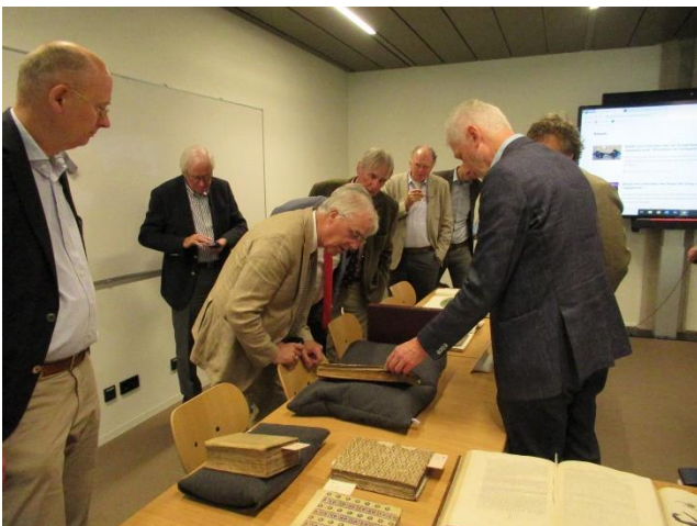
Presentatie bijzondere collectie voor leesgezelschap Middelburg, 25 september

Middelburg. Na een inleiding over geschiedenis en collectie kregen de gasten inzage in een selectie uit de bijzondere collectie.