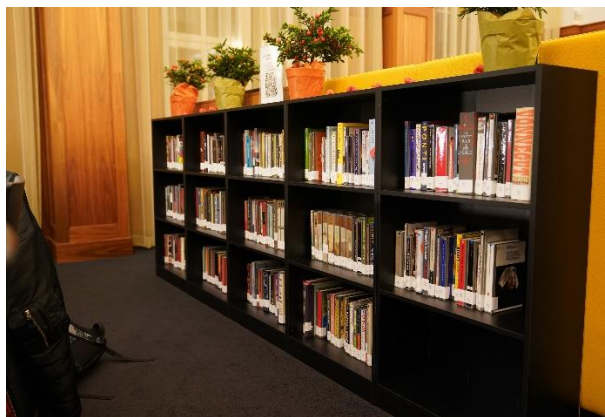
De collectie Reading without Borders in de bibliotheek van het EUC