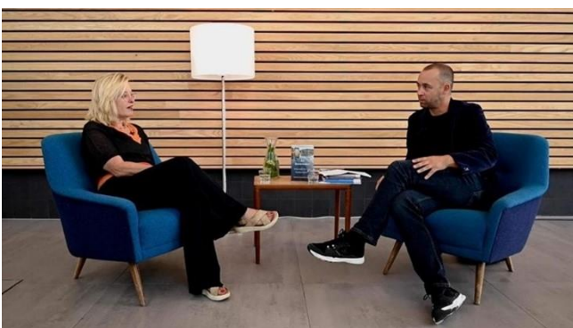
Interview door Berrie Vugts met Jet Bussemaker

Omdat publieksevenementen verder nauwelijks mogelijk noch verantwoord waren, heeft het Leeskabinet een serie van zes interviews met schrijvers gehouden in de studio op de campus van de universiteit en die vervolgens op het YouTube-kanaal van het Leeskabinet gepubliceerd. Om een groter, ook internationaal publiek te bedienen (zoals de studenten en medewerkers van de universiteit) werden de meeste interviews Engels ondertiteld. De UB maakte dit mogelijk. Alle interviews werden gehouden door Berrie Vugts. Het gemis aan publiek werd goedgemaakt door het veel grotere aantal kijkers dan in een zaal op een vaste datum en tijdstip mogelijk was geweest. Een echte topper is het interview met Sandra Langereis, over haar biografie van Erasmus, met eind 2021 al zo'n 1.500 kijkers. Zie bijlage 5 voor titels en kijkcijfers.