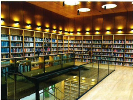
4 Studiezaal