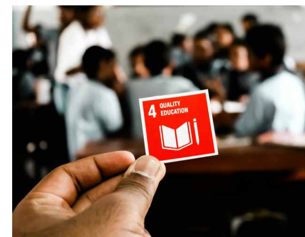
Stickertjes plakken blijkt onvoldoende te helpen.