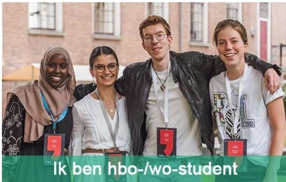
Ik ben hbo-/wo-student