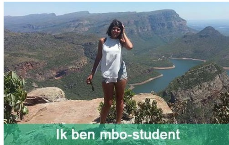
Ik ben mbo-student