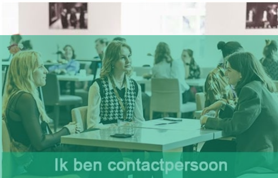
Ik ben contactpersoon