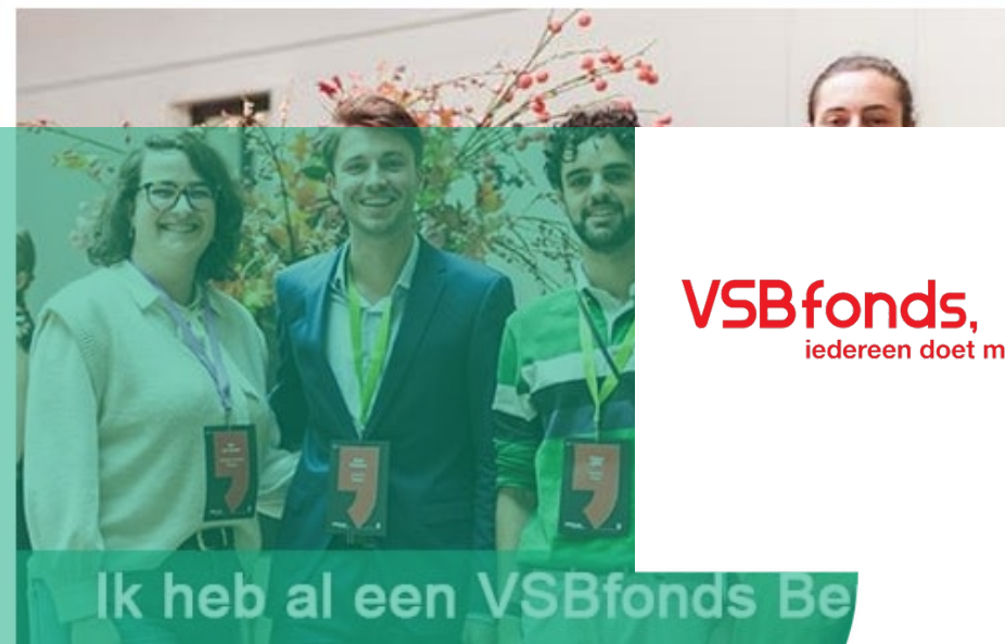
Ik heb al een VSBfonds Be