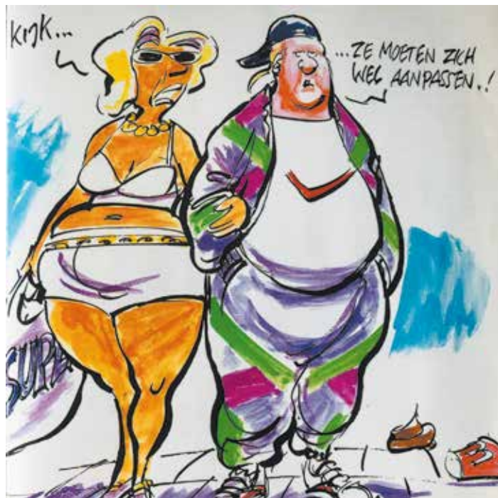
Figuur 1: Afbeelding bij hoofdstuk 'Buitenlanders willen zich niet aanpassen' (pp. 50-51) in 'Vooroordelen vertekenen' (Anne Frank Stichting 1997:5)