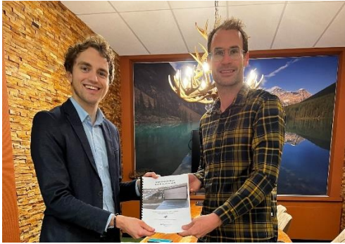
Afbeelding 1 Aanbieden rapport 'Van Black Box naar Glass Box'