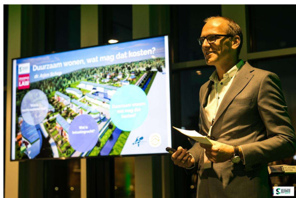
Science Hotel 23 november 2018