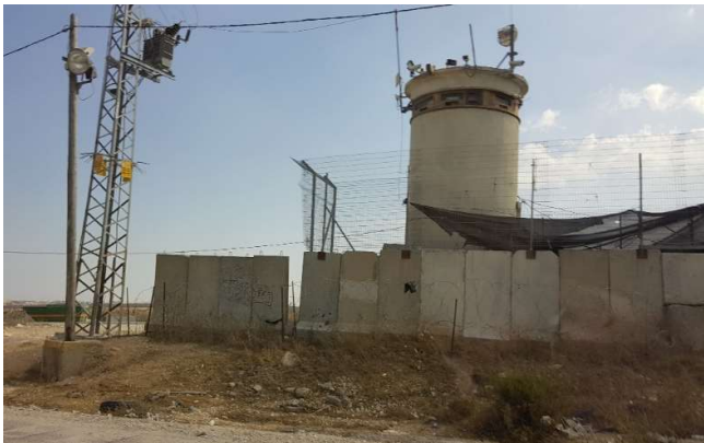
Israëliëse controlepost op de weg van Ramallah naar Jeruzalem

Arjen Schep is door VNG international gevraagd om vanuit het ESBL vanaf september als expert en onderzoeker bij te dragen aan een onderzoeksproject in de Palestijnse Gebieden. 17 Dit project wordt gefinancierd door het Ministerie van Buitenlandse Zaken. In opdracht van de Prime Ministers Office van de Palestijnse Autoriteit is vanaf september in een viertal missies het project voorbereid. Vanaf 2019 zal in een 7-tal gemeenten op de Westelijke Jordaanoever pilots worden opgestart waarin deze gemeenten erop worden voorbereid om vanaf 2020 zelf property tax te kunnen heffen. De resultaten van de pilots zullen worden uitgewerkt in te ontwikkelen Road Map op basis waarvan op termijn alle gemeenten in de Palestijnse Gebieden zelfstandig property tax kunnen gaan heffen.