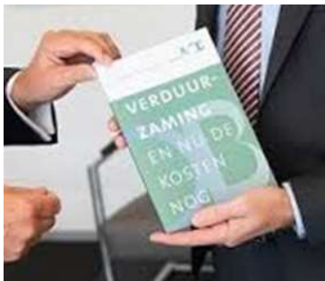
Essaybundel 'Verduurzaming, en nu de kosten nog'