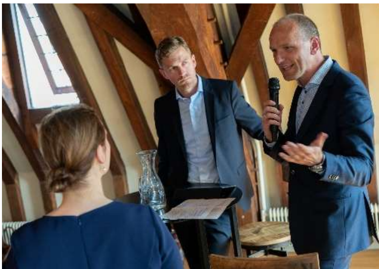
Dag van de financiële verhoudingen