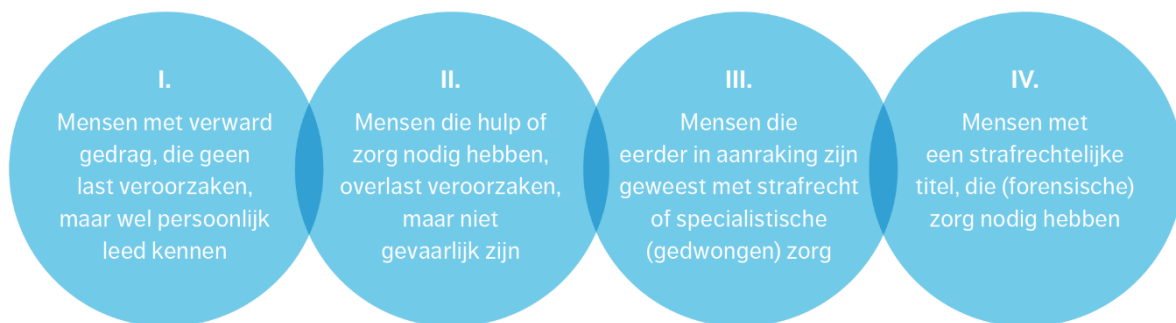
Figuur 1: vier categorieën voor mensen die verward gedrag vertonen

In deze definitie staan maatschappelijke kwetsbaarheid en risico centraal. De nadruk op overlast door personen met verward gedrag wordt in deze definitie omzeild, omdat dat " juist verkokering, afgebakende verantwoordelijkheden en stigmatisering " in de hand werkt (Aanjaagteam, 2016: p.5). Voorts worden in deze definitie vier categorieën van verwarde personen onderscheiden, grafisch weergegeven in de vorm van in elkaar grijpende cirkels: