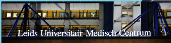
Leids Universitair Medisch Centrum