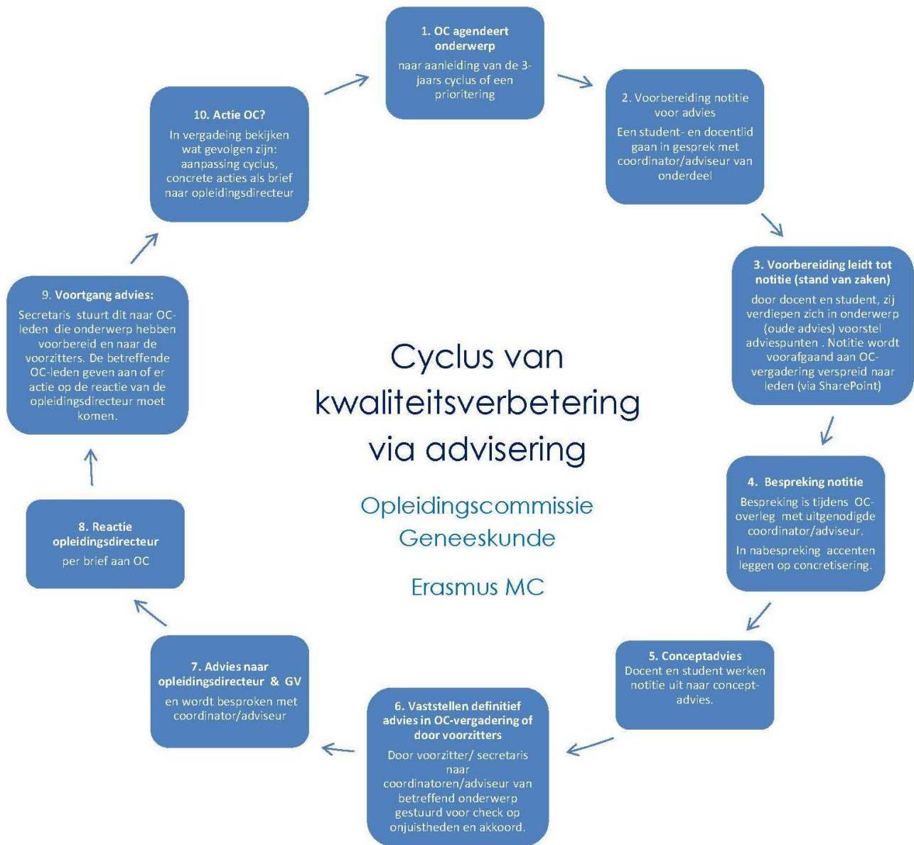
Figuur 1 Adviseringcyclus OC Geneeskunde