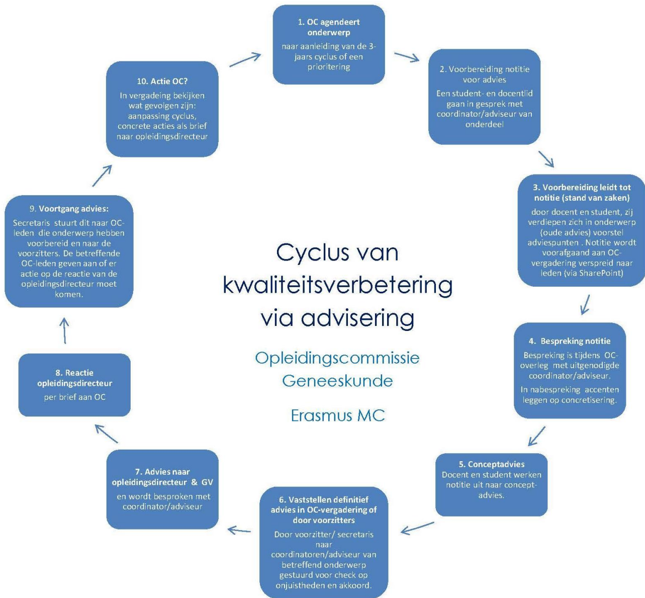
Figuur 1 Adviseringcyclus OC Geneeskunde