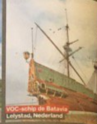
VOC-schip de Batavia Lelystad, Nederland