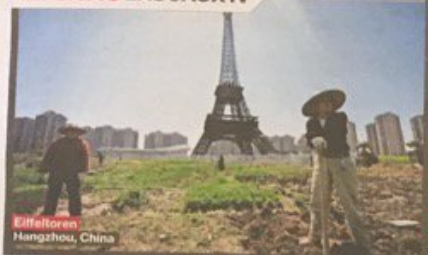
Eiffeltoren Hangzhou, China