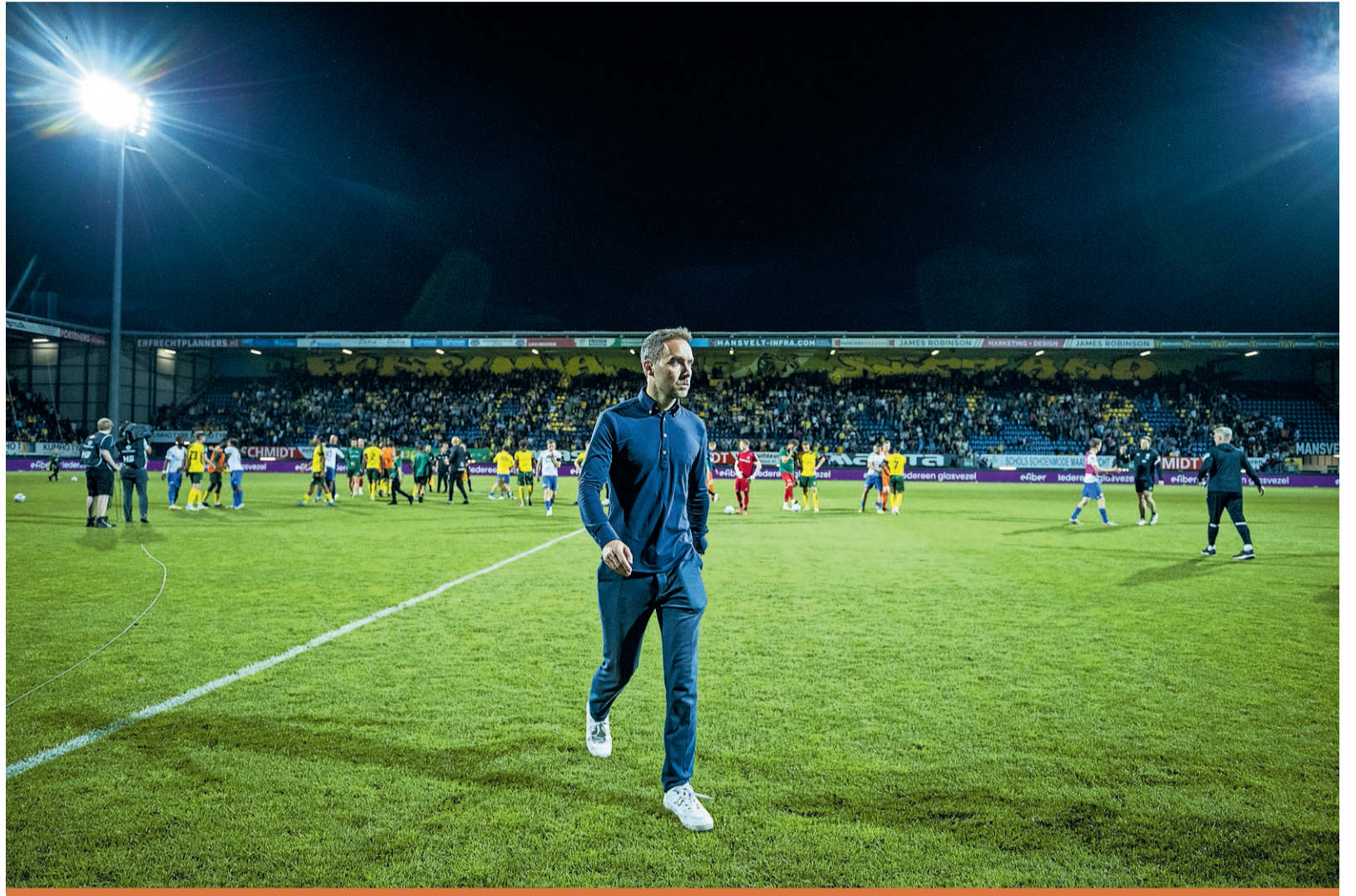
Fortuna Sittard heeft trainer Sjors Ultee na drie wedstrijden in het nieuwe voetbalseizoen ontslagen.

Yilmaz is een 37-jarige Turkse aanvaller die de afgelopen twintig jaar een indrukwekkende erelijst in het Turkse topvoetbal opbouwde. Hij