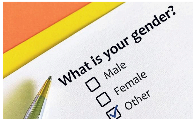
Volgens de kritische denkrichting bestaan er niet slechts twee geslachten, maar een groot aantal genders.