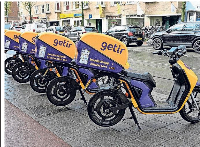
Nieuwe flitsbezorgers zijn niet welkom in Haagse winkelgebieden en woonstraten.

eiste drie weken geleden 18 jaar cel en tbs. De officier van justitie nam uitvoerig de tijd om uit te leggen waarom T. niet werd vervolgd voor moord. Dit had te maken met het feit dat, ondanks een extra aangevraagd onderzoek van de familie, niet bewezen kon