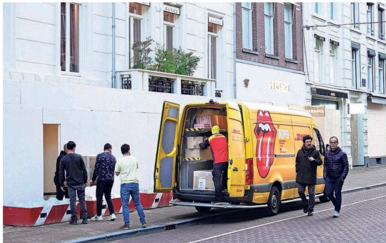
De pakketbezorging wordt duurder door de oorlog in Oekraïne.

Eerder leek Microsoft koploper te zijn om Mandiant in te lijven, volgens verschillende media. Dat bedrijf wil de komende vijf jaar $20 miljard aan cyberveiligheid uitgeven.