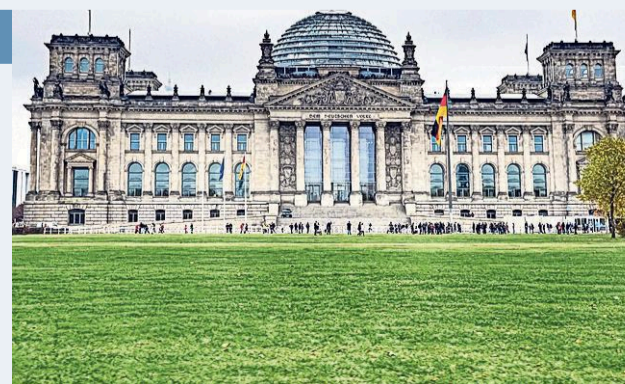
Beleggers zien een wisseling van de macht in Berlijn.

De primeur van drie Duitse partijen, beter bekend als stoplichtcoalitie, die het regeer-