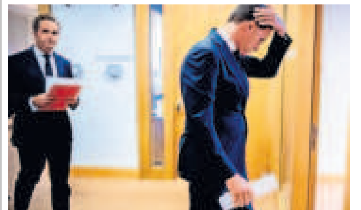
▲ Minister De Jonge en premier Rutte voor de persconferentie van afgelopen maandag.

In het landelijke pakket maatregelen dat er ligt gaan scholen niet dicht, mogen mensen sporten, blijft horeca deels open. Qua maximale groepsgrootte wordt onderscheid gemaakt tussen activiteiten binnen en buiten. Er is sprake van voortschrijdend inzicht. Mogelijk zal een eventuele nieuwe lockdown dan ook intelligenter zijn dan die van dit voorjaar.