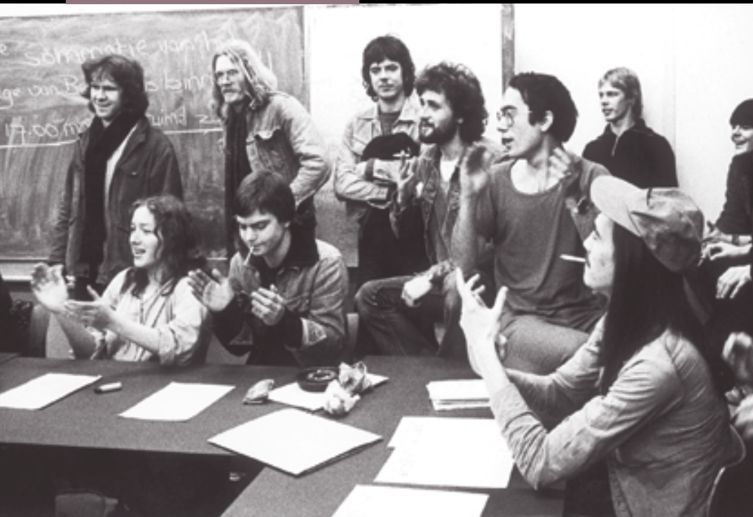
Bezetting van de faculteit, 1978

In de jaren zestig en zeventig had de ontplooiing van de faculteit zich intern afgespeeld. De discussies waren gericht op de uitbouw, herziening en verfijning van de opleiding en de Rotterdamse formule die daaraan ten grondslag lag. In de jaren tachtig werd de faculteit geconfronteerd met ontwikkelingen die zich van buiten af aan de universitaire gemeenschap opdrongen. Zo werd in 1982 eerst de Wet Tweefasenstructuur doorgevoerd die van grote invloed was op de inrichting en opbouw van de bestaande studierichtingen. In de jaren 1983 en 1986 volgden respectievelijk de bezuinigingsrondes Taakverdeling en Concentratie Wetenschappelijk onderwijs (TVC) en Selectieve Krimp en Groei (SKG). De bezuinigingen hadden ingrijpende gevolgen voor het hoger onderwijs in het algemeen en de faculteit sociale wetenschappen in het bijzonder.