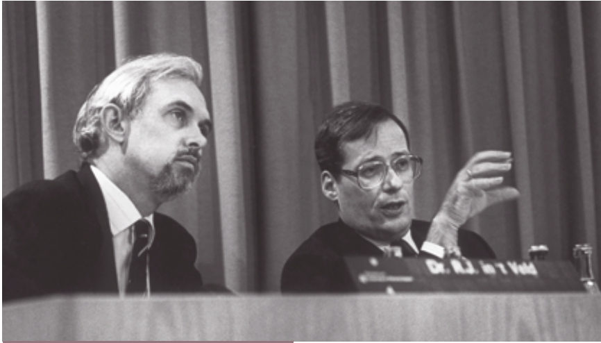
Directeur-generaal In 't Veld en minister Deetman

wijs en Wetenschappen. Minister Deetman wilde op nieuw 130 miljoen gulden besparen. Deetman verbrak daarmee zijn belofte, die hij enkele jaren eerder had gedaan in het kader van de TVC-operatie, om een vergelijkbare bezuinigingsronde binnen een decennium niet te herhalen. 12