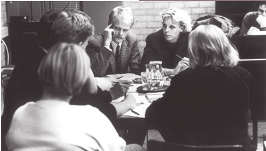
Simulatiespel tijdens de protestnacht

moeten kunnen geven aan een machtscentrum, dat in de gelegenheid zou moeten zijn belangrijke knopen zelfstandig door te hakken. Het gebrek aan daadkracht dat de universiteit nu oprak liet zich volgens Van Doorn omschrijven als 'de wraak op de jaren zestig'.