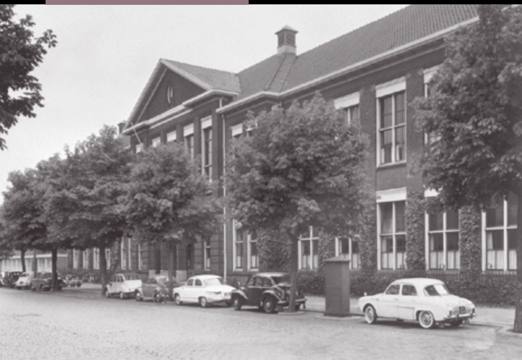
De NEH aan de Pieter de Hoochweg, 1962