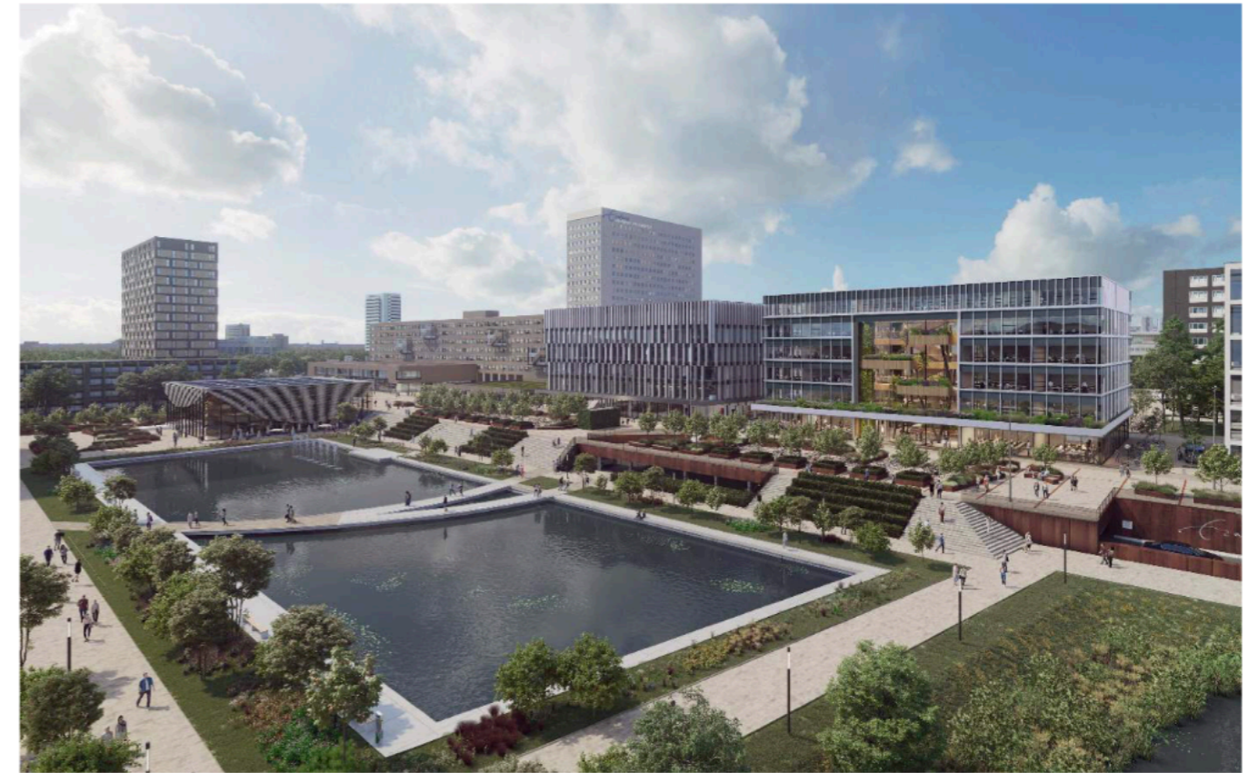
Artist's impression van het zes verdiepingen tellende onderwijsgebouw op de Erasmus Campus Rotterdam.