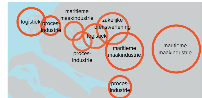
Impact van wederuitvoer (opslag & distributie) reikt over veel breder gebied.

De economische impact van mainport Rotterdam op de omgeving naar sector.