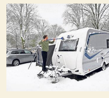
Kamperen is bezig aan een opmars.

Vorig jaar werden iets minder dan 2500 nieuwe campers verkocht, een stijging van bijna 1%. De voertuigen zijn al jaren populair. In ruim acht jaar tijd is het aantal in Ne-