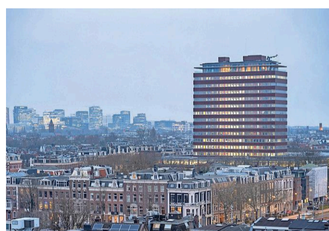
De ronde toren, die sinds 1991 in het complex werd geplaatst, is verdwenen en dat is volgens architect Houben maar goed ook.

Een nieuwe versie van het Paleis voor Volkslijdt dat op deze plek in 1929 afbrandde is het niet geworden, ondanks de pleidooien van sommige Amsterdammers. Wel is het gebouw teruggebracht naar het Mid-Century Modernistische ontwerp van architect Marius Duintjer uit 1961. De meest opvallende