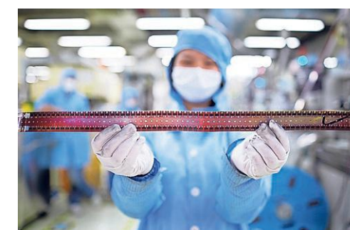
Ook serieproductie in China gewenst, aldus NXP uit Eindhoven.

Het Eindhovense NXP, dat sterk is in de automotive-sector en netwerktechnologie werkt al samen met Vanguard International, een onderdeel van TSMC. Het gaat om de productie van 130 tot