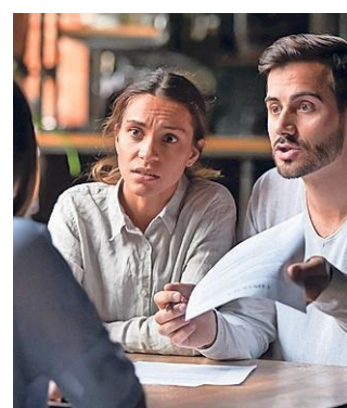
Ondernemers komen moeilijk aan extra geld.

Uit het onderzoek blijkt dat ruim één op de tien ondernemers nu of het komend halfjaar financiering aan of verandering van huisvesting. Bijna één op de vijf wil het inzetten voor de herfi-