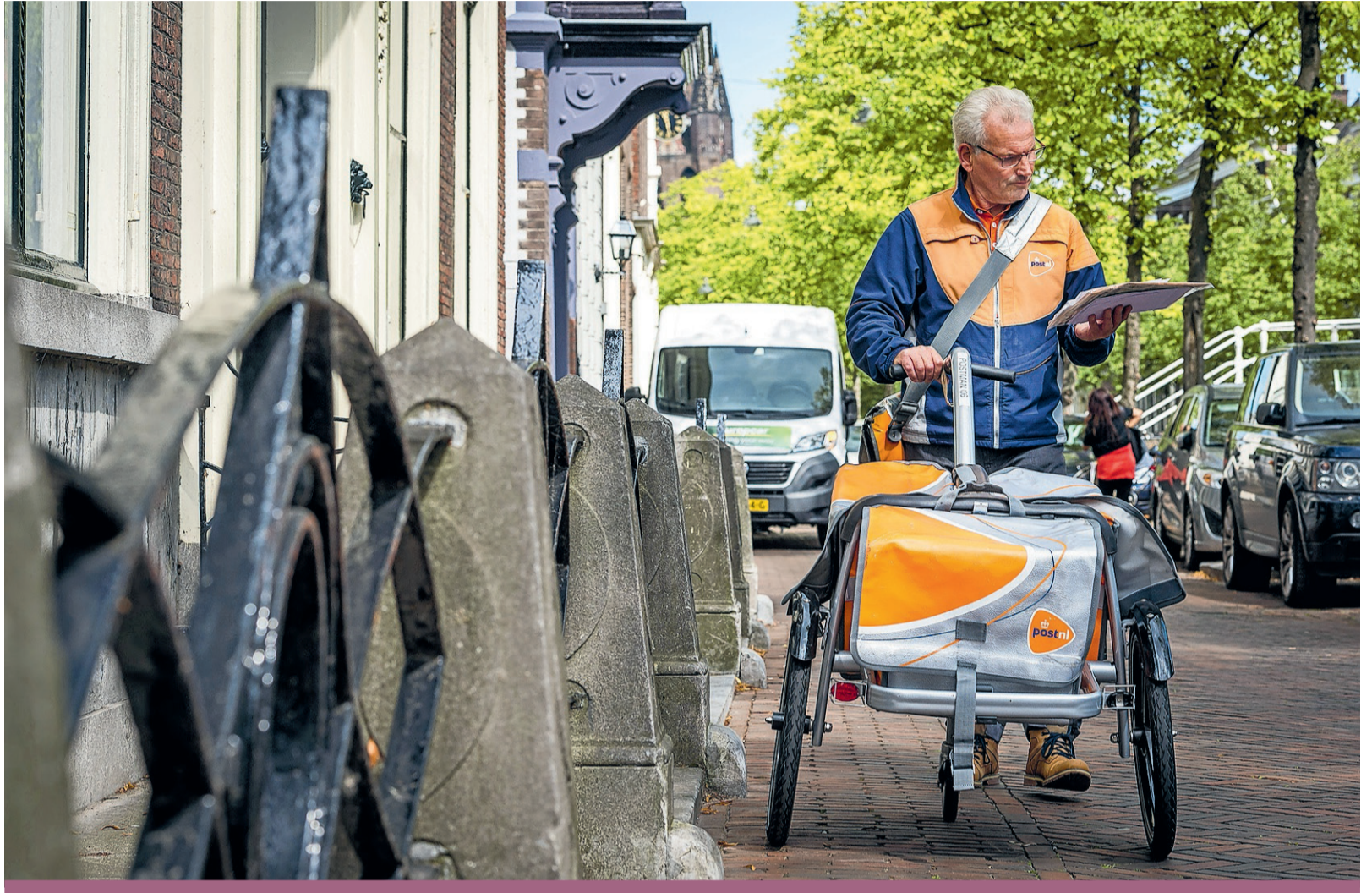
PostNL biedt alle postbezorgers een vast contract aan.

Notten: ‘De gemiddelde werkweek is in Nederland korter dan in veel Europese landen. Slimmer werken en de inzet van technologie waardoor de productiviteit omhooggaat is een op-