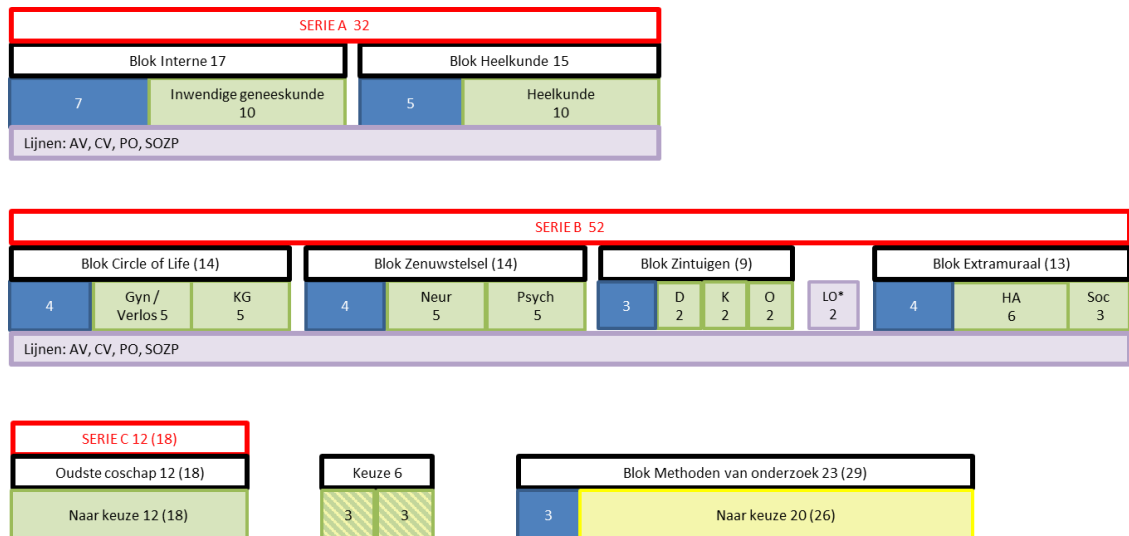
Afbeelding 1 Curriculum overzicht Erasmusarts 2020

*LO2 staat voor zelfstudietijd voor wat betreft opdrachten uit het lijnonderwijs.